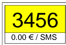
Illustration 4: Couleurs possibles